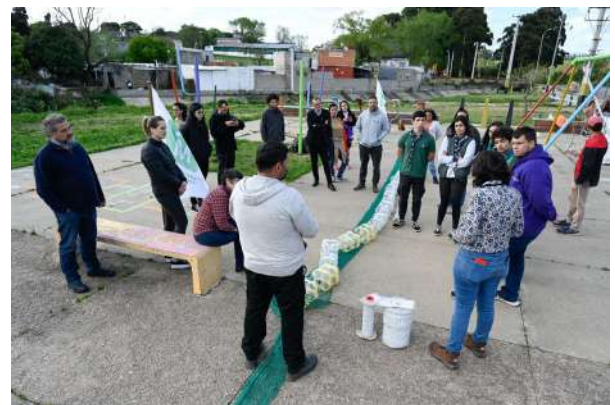
Contrucción en instalación de biobarreras con la población y organizaciones sociales

Estos equipos son de muy bajo costo y la durabilidad de los mismos se considera del orden de seis meses a un año. Se encuentran al sol, parcialmente sumergidos y la variabilidad de alturas de profundidad de agua genera que los amarres, además de ser fuertes, deben ser flexibles para adaptarse a la variabilidad de profundidad que presentan los cauces. Esta durabilidad implica tener una