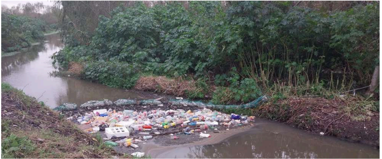
Biobarda instalada en Bajo Valencia

Cámara Mercantil de productos del país planificación de recambio anual.